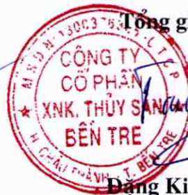
Đặng Kiệt Tường