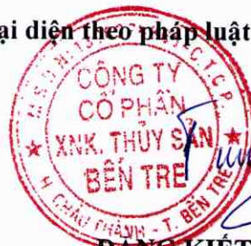
DẶNG KIẾT TƯỜNG Chủ tịch HĐQT

Xác nhận của đại diện theo pháp luật của Công ty