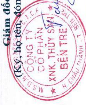
DẶNG KIẾT TƯỜNG