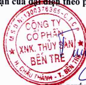
ĐẶNG KIẾT TƯỜNG Chủ tịch HĐQT

Xác nhận của đại diện theo pháp luật của Công ty