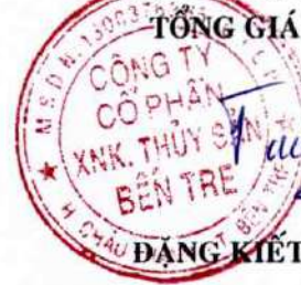
ĐANG KIẾT TƯỜNG